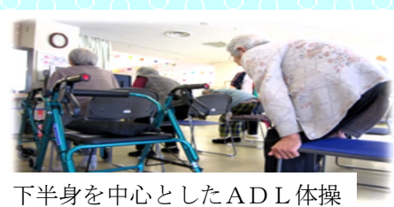
下半身を中心としたADL体操